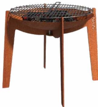
COSA + GRILL