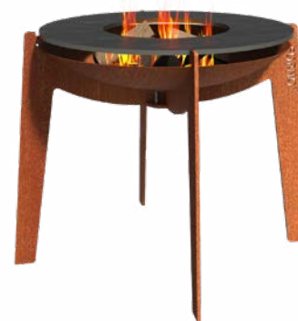
COSA + BAKPLAAT