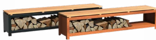
HOUTOPSLAG MET ZITTING