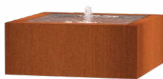
WATERTAFEL VIERKANT CORTEN