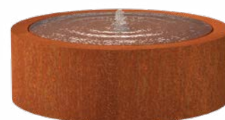
WATERTAFEL ROND CORTEN