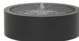
WATERTAFEL ROND ALUMINIUM