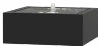
WATERTAFEL VIERKANT ALUMINIUM