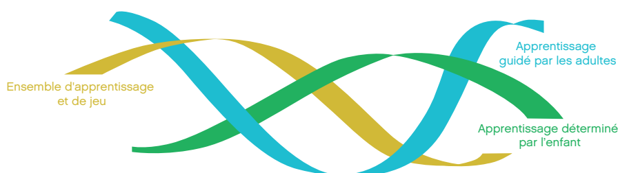
Fig 1 – Approches intégrées en matière d'enseignement et d'apprentissage

L'apprentissage basé sur le jeu et les approches telles que l'apprentissage fondé sur la recherche, la pédagogie active et l'apprentissage expérientiel sont fondés sur les mêmes théories d'apprentissage. Ces théories reposent sur l'idée que les enseignants et éducateurs doivent coopérer pour construire ensemble la connaissance. Les environnements d'apprentissage sont volontairement conçus pour maximiser les possibilités visant à encourager la créativité, l'interaction sociale, l'expérimentation et l'amour de l'apprentissage.