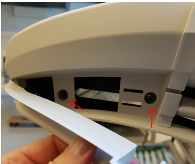
foto onder: Haken losmaken door beide aan weerszijde van het midden gelijktijdig in te drukken