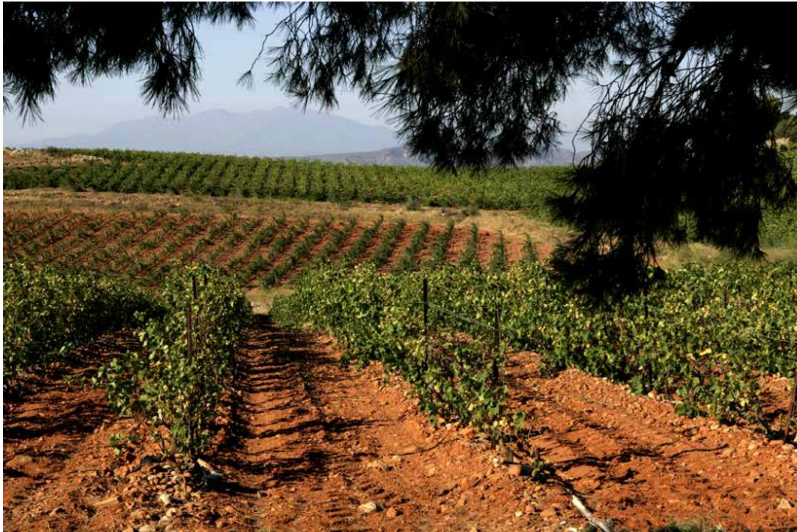
Volgens geologen behoort de 'Mas de Passe-Temps' van Domaine Singla tot de oerkorst van de aarde.

'La Matine', Côtes du Roussillon-Villages, 60% grenache/40% syrah.