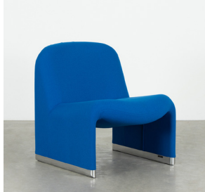
Trevira Stof Blauw