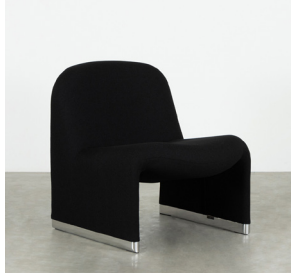
Trevira Stof Zwart