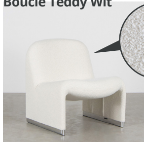
Bouclé Teddy Wit