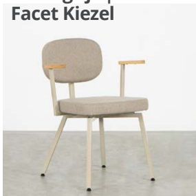
Kiezelgrijs | Facet Kiezel