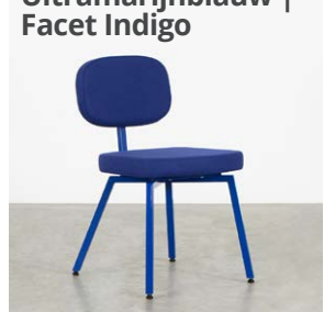
Ultramarijnblauw | Facet Indigo