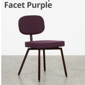
Zwartrood | Facet Purple