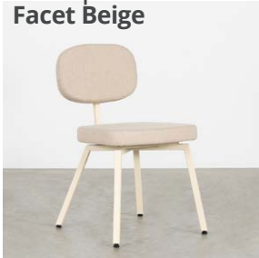
Ivoor | Facet Beige