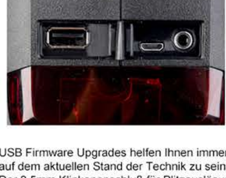
USB Firmware Upgrades helfen Ihnen immer auf dem aktuellen Stand der Technik zu sein. Der 3.5mm Klinkeanschluss für Blitzauslösung zur Erreichung manueller Blitzmethoden.