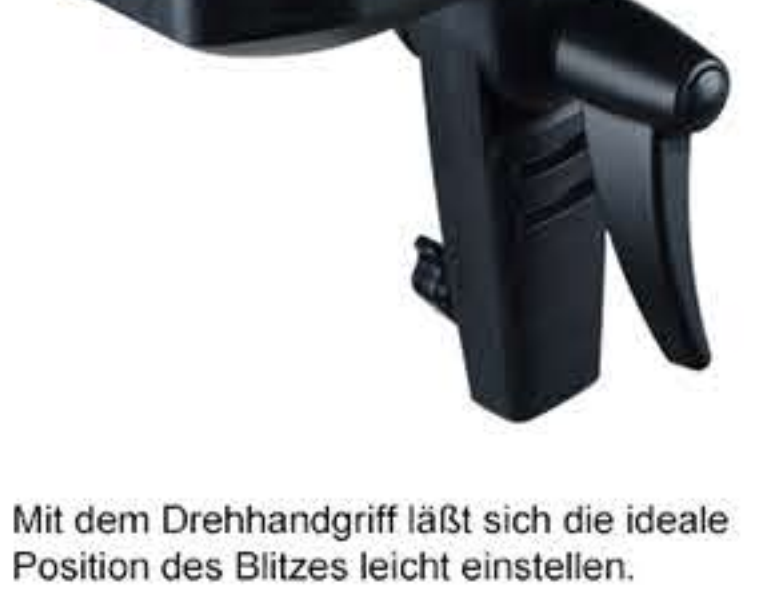
Mit dem Drehhandgriff lässt sich die ideale Position des Blitzes leicht einstellen.