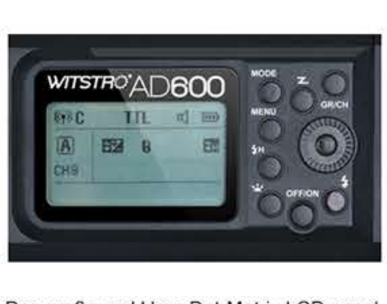
Das große und klare Dot-Matrix LCD panel mit bequemem Bedienkomfort.