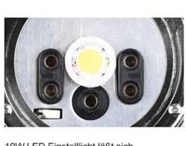
10W LED Einstelllicht lässt sich in drei Stufen variieren.