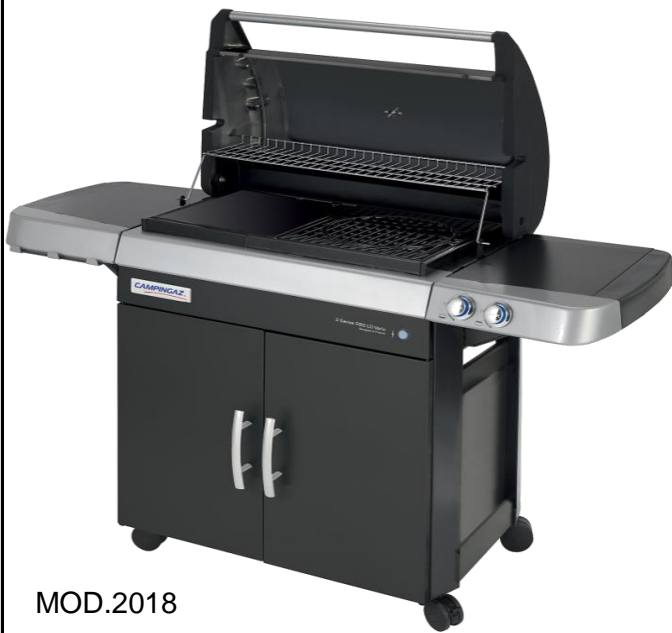
MOD.2018 3 SERIES RBS LD VARIO CLASS 3 RBS LD