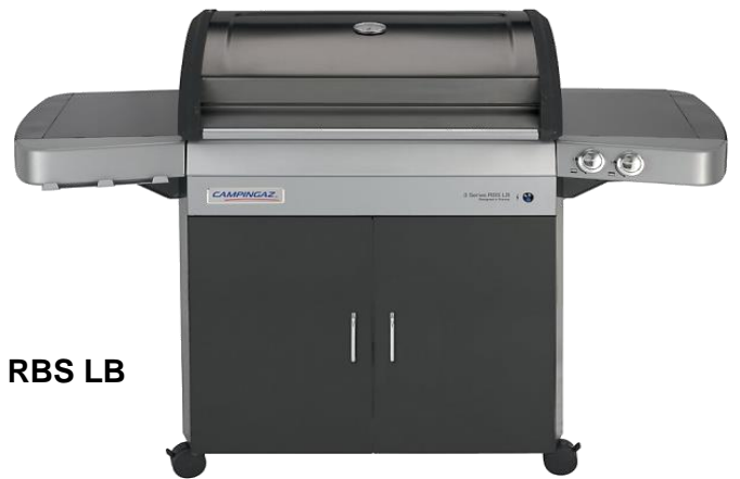
3 SERIES RBS LB