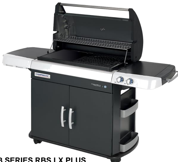
3 SERIES RBS LX PLUS