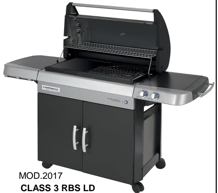
MOD.2017 CLASS 3 RBS LD