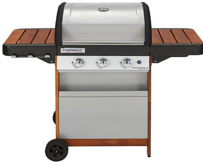
3 SERIES WOODY LX