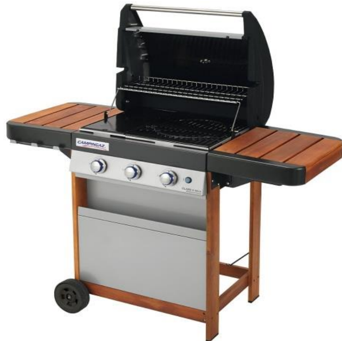
CLASS 3 WLX (ELECTRONIC) CLASS 3 WLX FR (PIEZO)