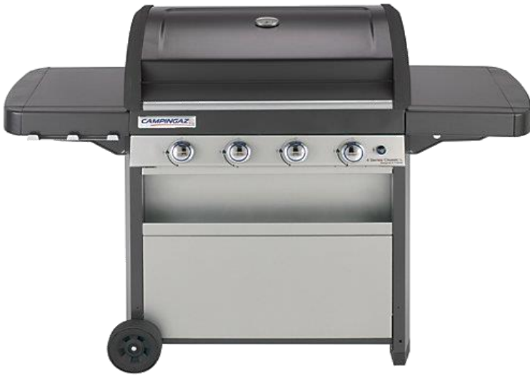
4 SERIES CLASSIC L CLASS 4L