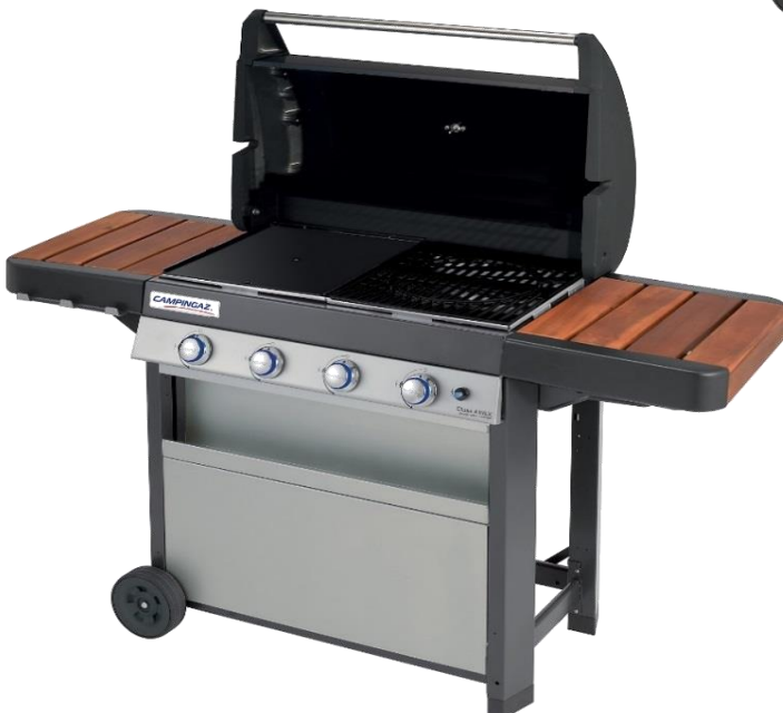
CLASS 4 WLX