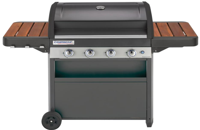
4 SERIES CLASSIC WL / WLD / WLD PLUS