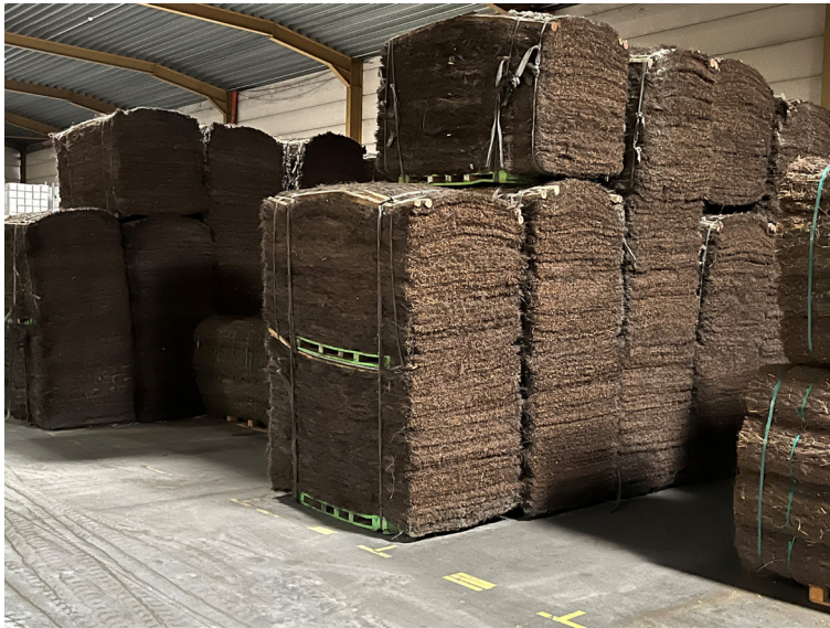
Pallettisatie: 40 panelen / pallet