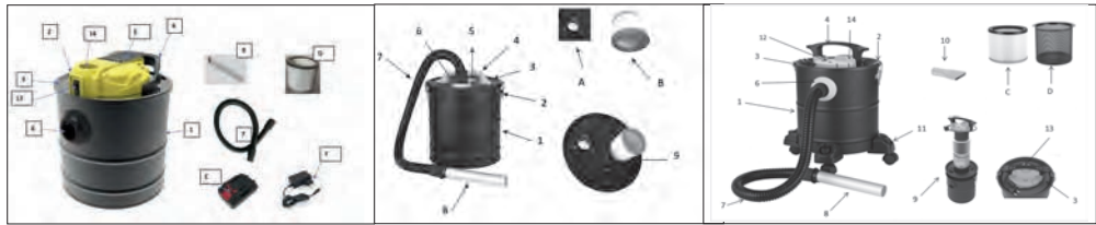
Pic 1: 2.1