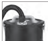
Pic 4: ASE 1020