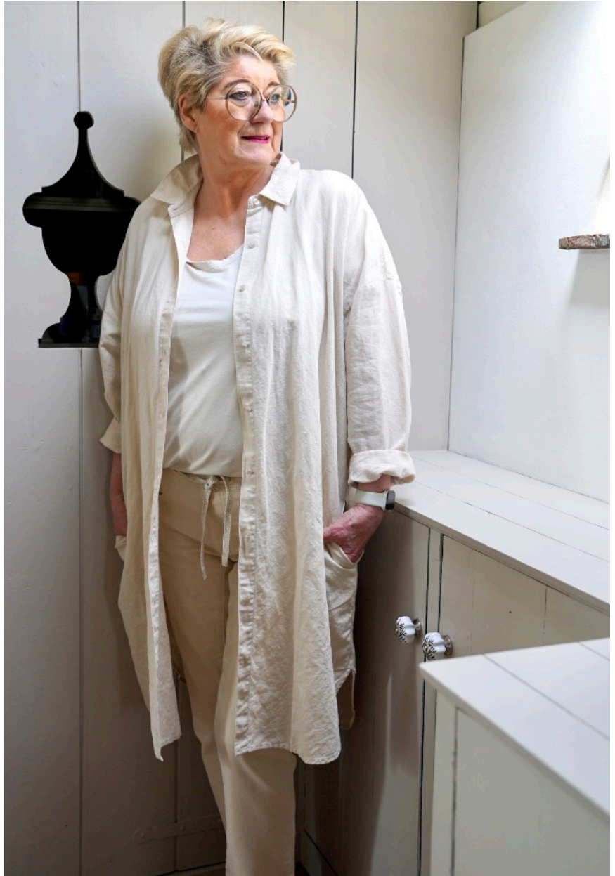
Mieke Blousejurk: 189,90 Top: 79,90 Broek: 119,95