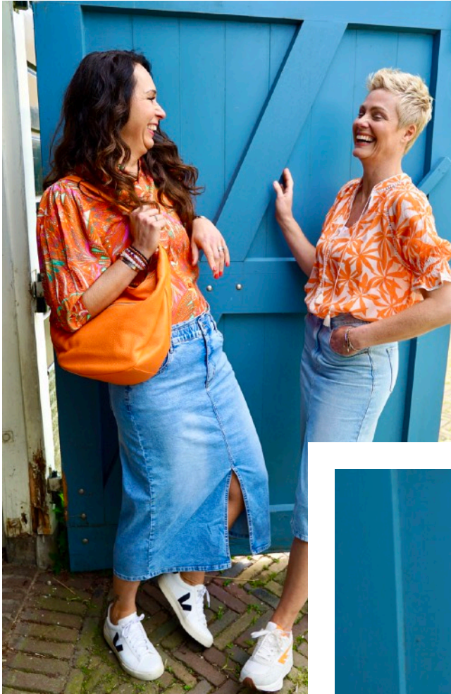
Denise Blouse: 89,95 Rok: 55