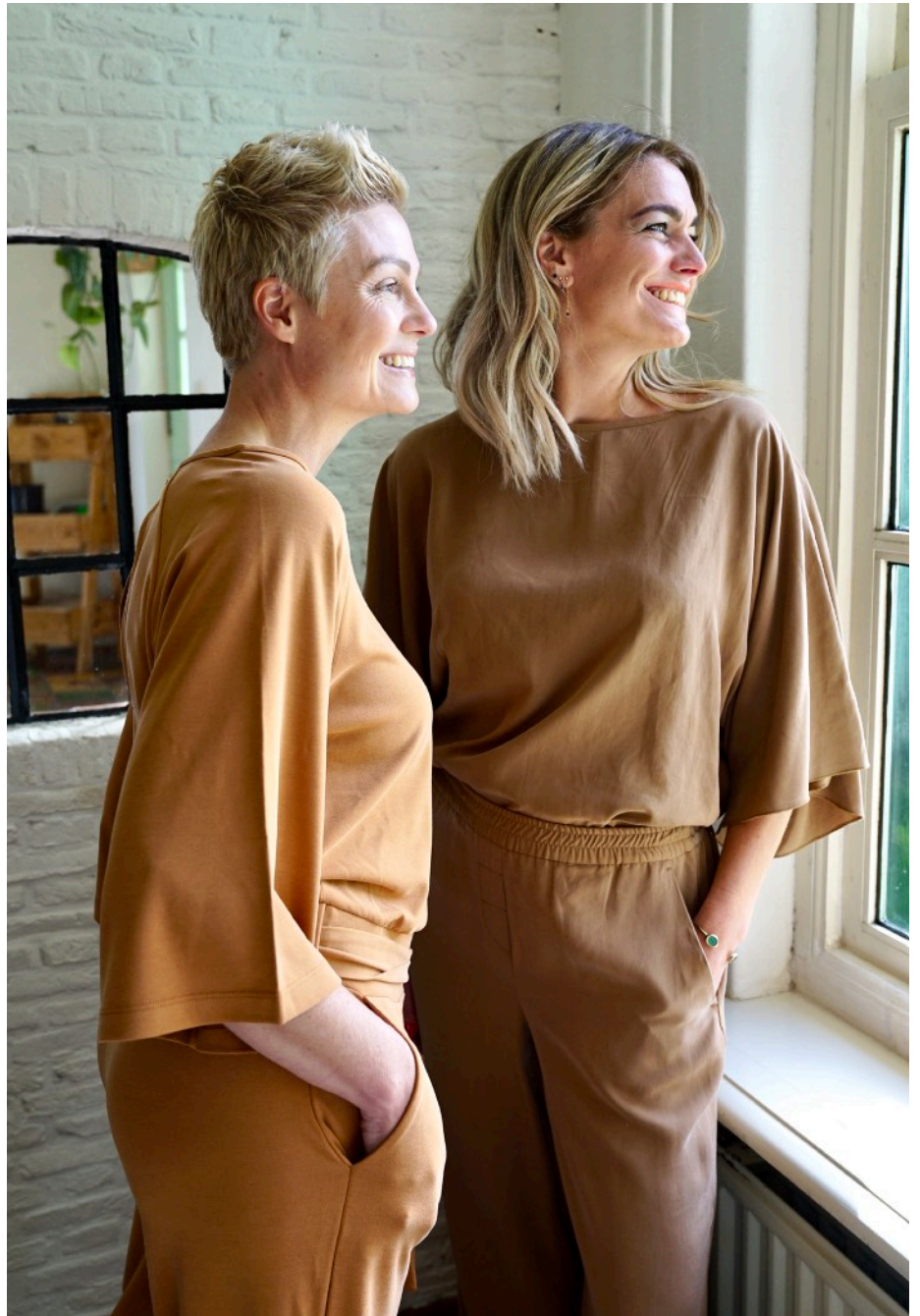
Denise Jumpsuit: 169,95