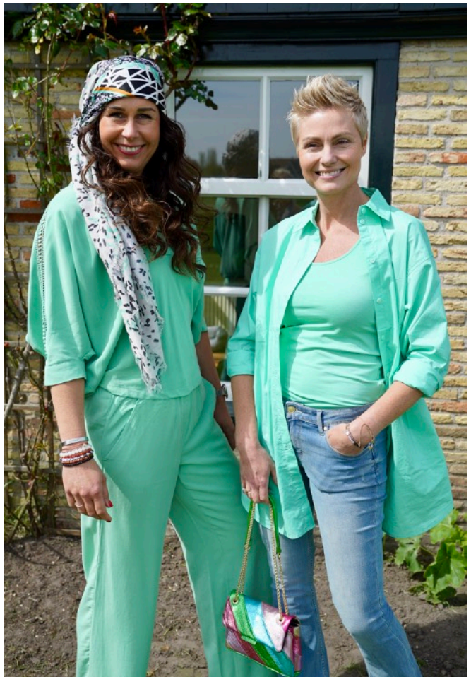
Kim Blouse: 109,95 Broek: 109,95 Sjaal: 69,95