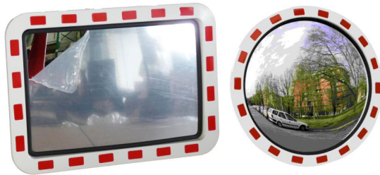
Traffic de Luxe