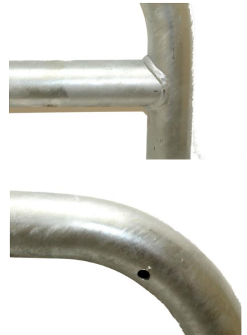
Fietsbeugel met tussenbuis Arceau à vélo avec barre transversale

° Voorzien van twee ontluichtingsgaten voor de galvanisatie