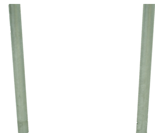
Fietsbeugel met tussenbuis Arceau à vélo avec barre transversale