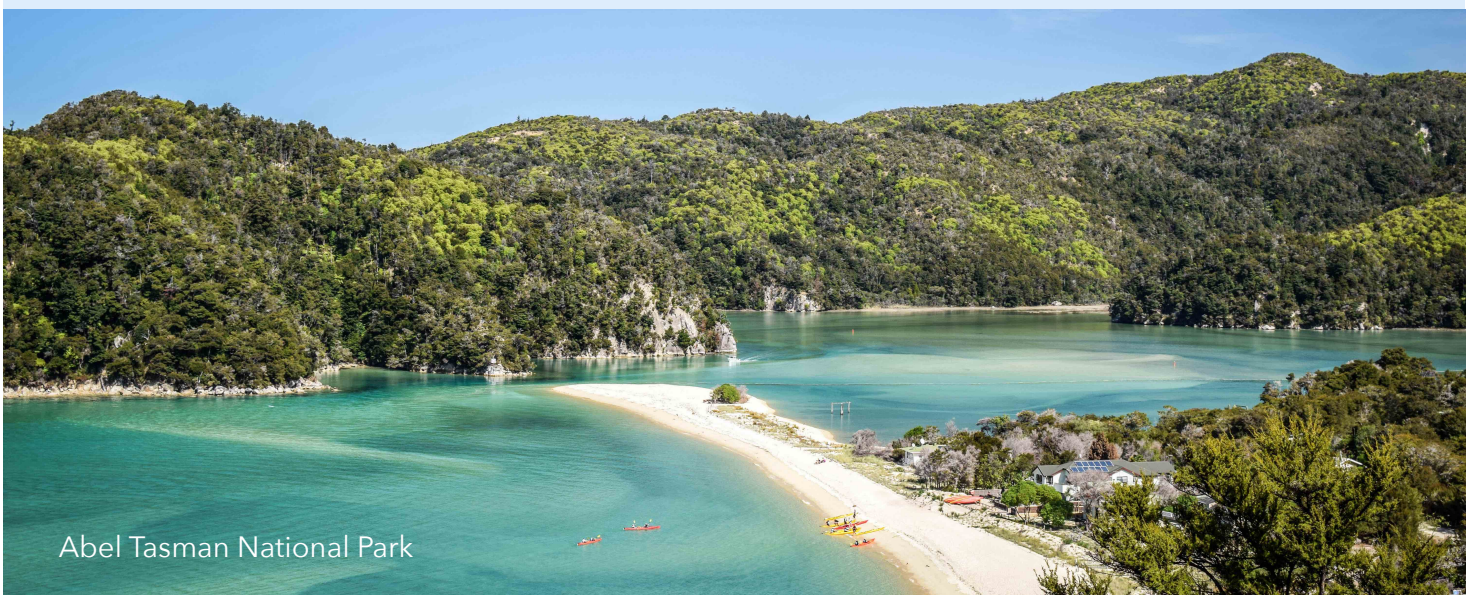
Abel Tasman National Park

Mijn allereerste reis in 2002. Ik maakte toen kennis met de prachtige natuur en raakte direct in de ban van dit prachtige land. Het zou nog negen jaar duren voor ik terug kon gaan, maar sinds 2017 kom ik er, met uitzondering van de periode van de pandemie, elk jaar.