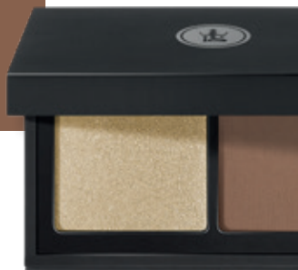
10- OR VÉNITIEN & BRUN BAROQUE