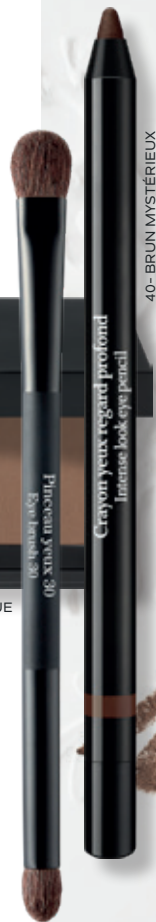
40- BRUN MYSTÉRIEUX

Appliquer la teinte dorée au coin interne de l'œil dessus et dessous avec l'embout rond du Pinceau yeux 30 .