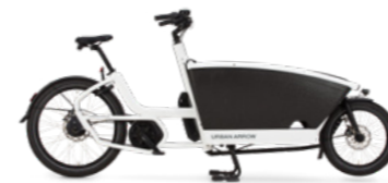
Tweewieler (Long John)

De Longtail heeft daarentegen ook weer zijn unieke eigenschappen. De laadbak bevindt zich achter het stuur en biedt meer ruimte voor bagage en extra passagiers. Door het compacte ontwerp parkeer je moeiteloos de fiets op kleinere parkeerplekken.