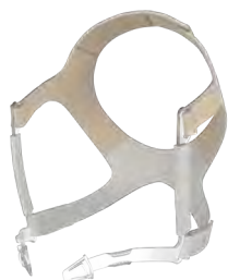
Harnais JULIA avec clips pour harnais Standard : LMT 26856 Large : LMT 26949