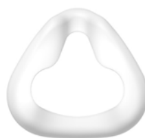
Jupe du masque JULIA Taille S : LMT 26636 Taille M : LMT 26637 Taille L : LMT 26638