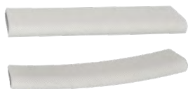
Protège-harnais, 2 unités LMT 17830