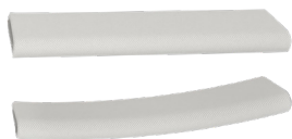
Hoesje 2 st. LMT 17830