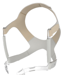
Hoofdband JULIA incl. bandclips standaard: LMT 26856 groot: LMT 26949