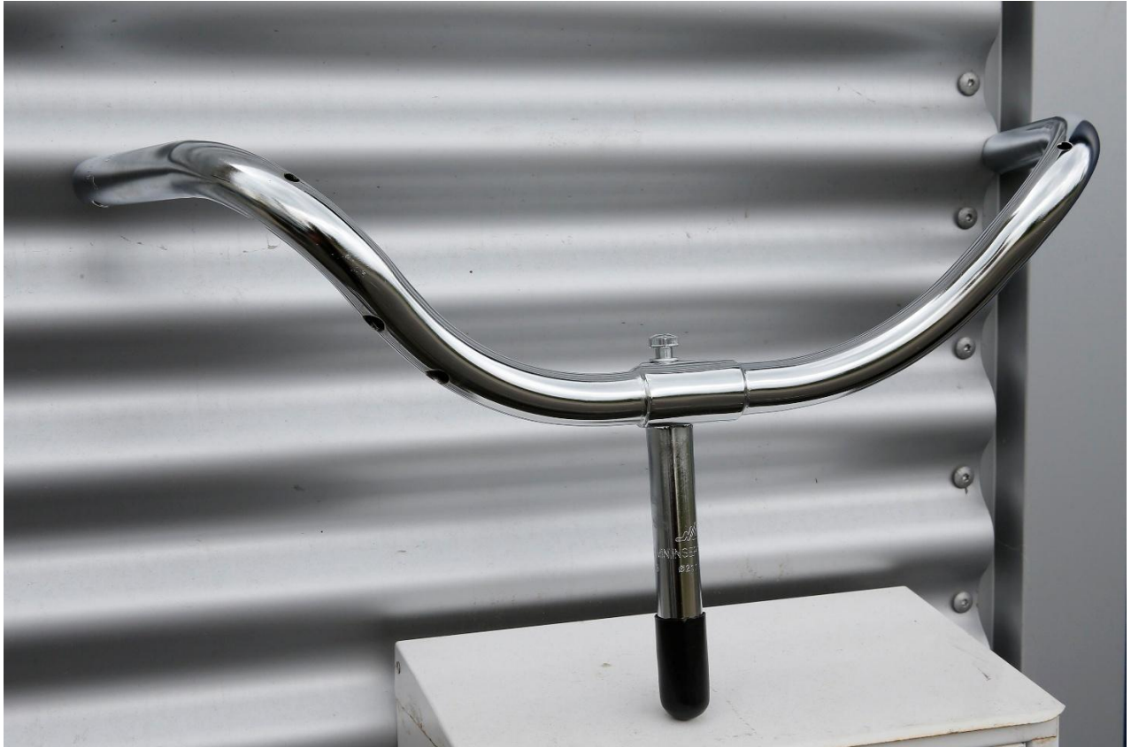
Deze gebogen sturen zijn heel mooi, een eerdere serie was te dik.