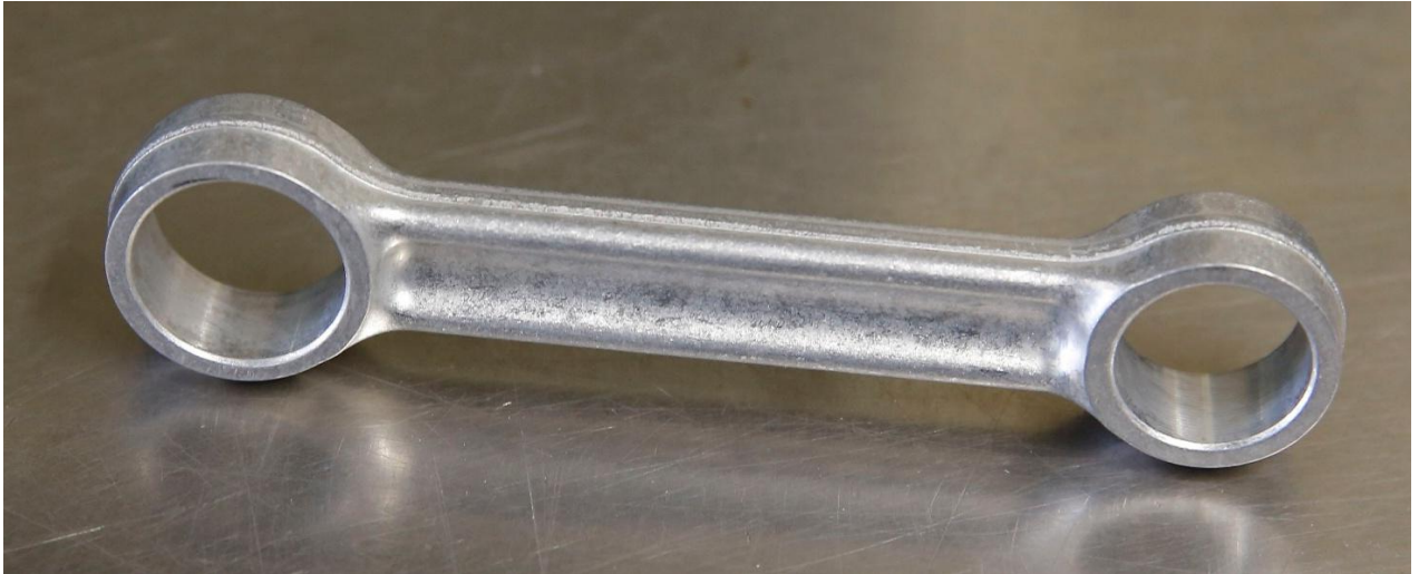
Verbeterde lichte drijfstang. Dankzij de rib is hij 25 procent sterker