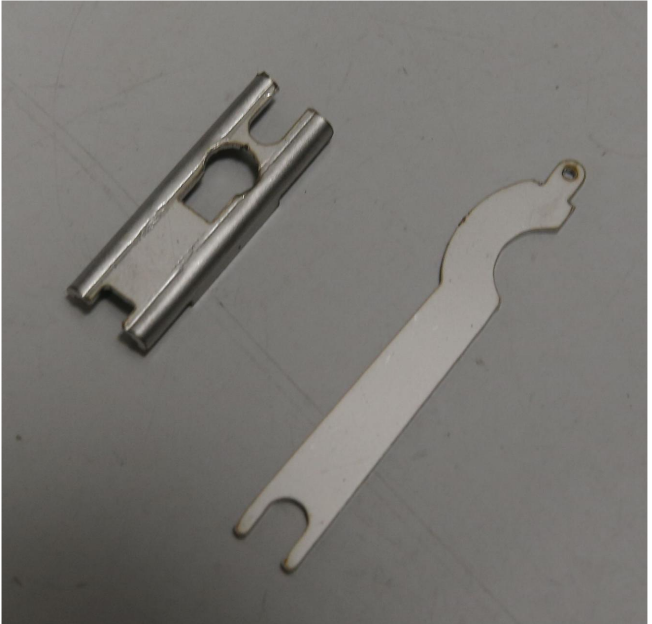
Kleplichter setje van rvs. Voor € 5,95 excl. BTW nooit meer last