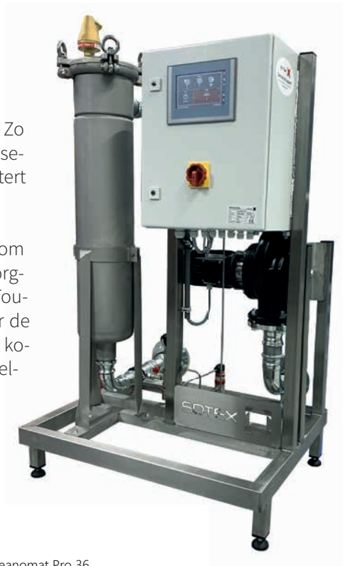
Cleanomat Pro 36

De units zijn gelijk aan de opbouw van de SFU(P)+ serie en worden geleverd in de volgende capaciteiten: 6, 12, 20, 36, 54, 72 en 108 m 3 /uur.