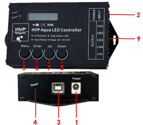
(Afbeelding 1: controller layout)