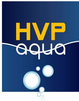
HVP Aqua 5 kanaals WIFI controller