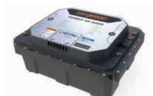
Power accu 48-5000