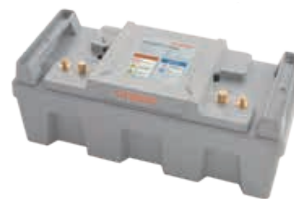
Power accu 24-3500

Bij gebruik van de Power 48-5000 accu met de Cruise 4.0 is een gateway set nodig, deze kost € 300.