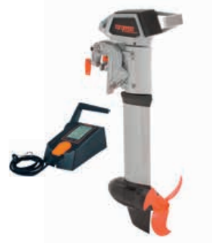
Cruise 2.0/4.0 R