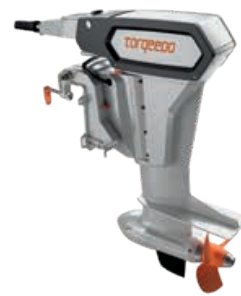
Cruise 10.0 T