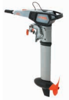
Cruise 2.0/4.0 T