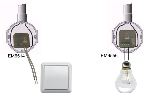
Figuur 1: EM6514 Wandschakelaar Sensor

Onderstaande afbeelding laat een van de meest gangbare situaties zien, waarin een EM6556 Mini schakelaar gebruikt kan worden i.c.m. een EM6514 Wandschakelaar Sensor. Door gebruik te maken van de EM6514 (apart verkocht, niet bijgeleverd) heb je de mogelijkheid om naar eigen wens met je bestaande wandschakelaar een scene in je (woon)kamer te starten.