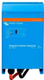
Phoenix Wechselrichter Compact 24/1600

Die Möglichkeiten mit parallel geschalteten Wechselrichtern sind tatsächlich erstaunlich. Vorschläge, Beispiele und Kapazitätsberechnungen können Sie in unserem Buch 'Immer Strom' nachlesen. (Kostenfrei erhältlich bei Victron Energy und herunterladbar von www.victronenergy.com ).