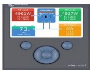
Color Control GX