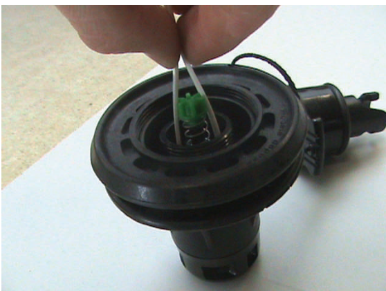
5. druk het indraaiventiel zover mogelijk in het grote ventiel