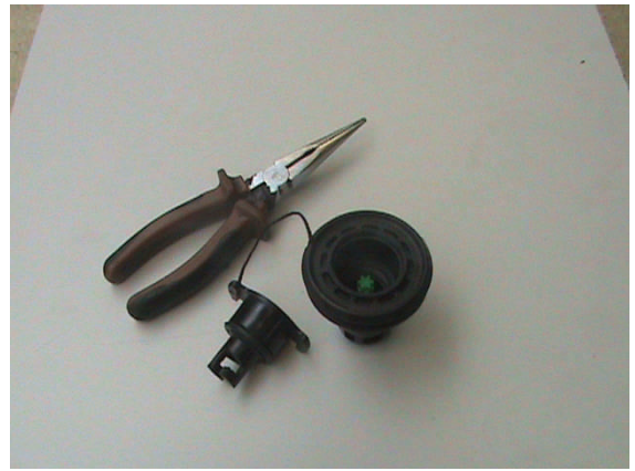
2. Benodigdheden zijn punttang, en 2 roerstaafjes