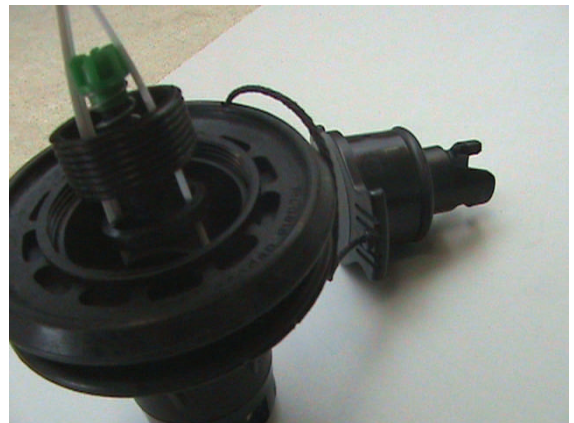
4. breng het indraaiventiel voorzichtig in het grote ventiel