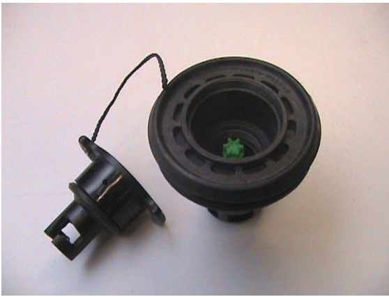
1. Vervangen van een Zodiac indraaiventiel