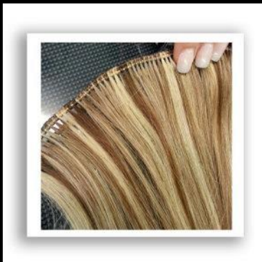
Handgemaakte weft :

Wanneer er een nieuwe kleur beschikbaar is, krijgen onze partners een envelop met een nieuwe kleurenstaal toegezonden. Deze kan dan aan de kleurenring worden toegevoegd.