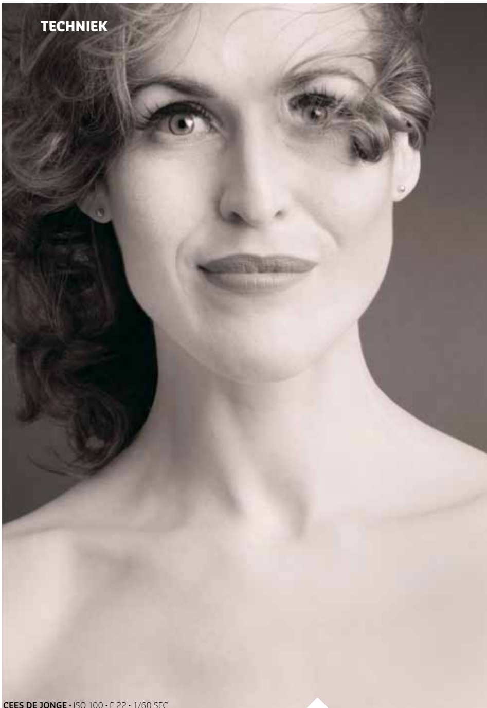
CEES DE JONGE • ISO 100 • F 22 • 1/60 SEC

Een mooi model, goede visagie, een ventilator en een flitsset waren de bron voor deze door de jaren dertig geïnspireerde opname.