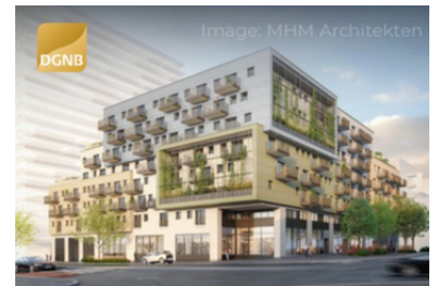
STRABAG Green Cube, AT

HIER ZORGT SCHAPENWOL VOOR PERFECTE RAAMAANSLUITINGEN.