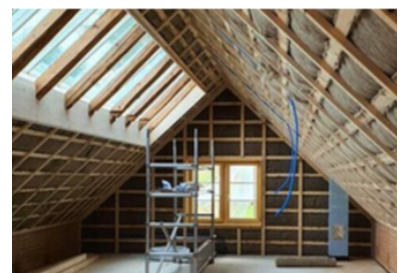
Multi-unit gebouw, CH