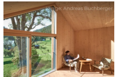
Privéwoning "Wildburger", AT