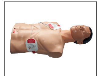
Plaatsen van de AED pads