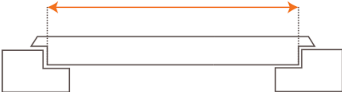
Breedte maat opdeur.