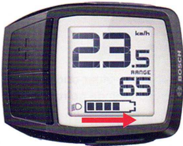
Module = AAN