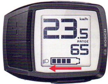
Module = UIT