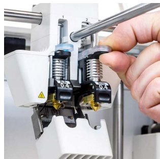
Print core BB Snel verwisselbare nozzles voor bouw- en in water oplosbare ondersteunende materialen. Verkrijgbaar in 0,25, 0,4 en 0,8 mm