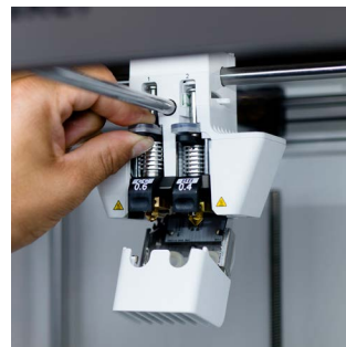
Print core CC Robijn in de punt voor het printen van abrasief glas en koolstofvezelcomposieten. Verkrijgbaar in 0,4 en 0,6 mm