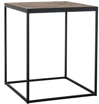
7315 60x50x50 cm