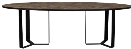
7311 76x240x100 cm