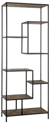
7319 210x80x42 cm