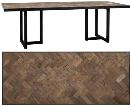
7309 76x200x100 cm 7310 76x240x100 cm