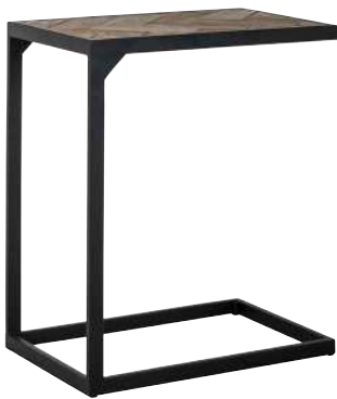
7316 65x55x35 cm