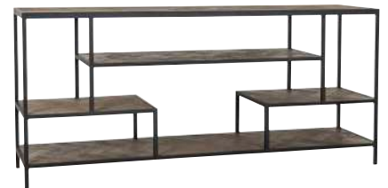
7318 85x190x45 cm