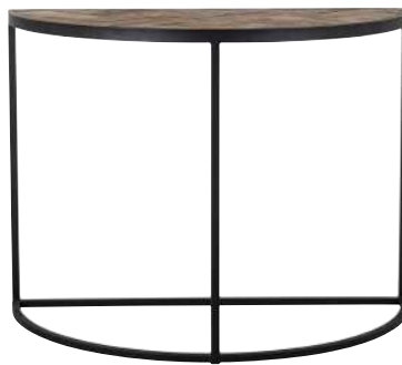
7314 76x100x50 cm