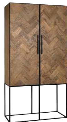
7321 210x110x50 cm