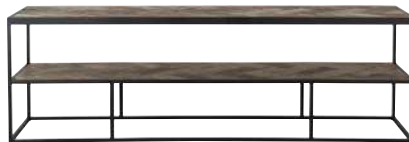
7317 50x160x40 cm