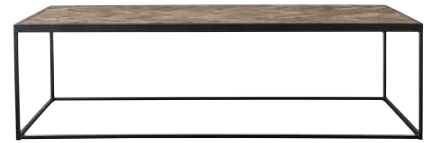
7312 40x140x70 cm