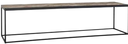
7313 40x160x40 cm