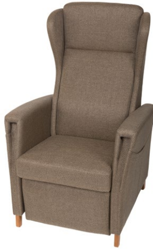
Model 582 Elevo