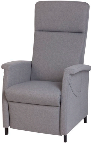
Model 580 Elevo