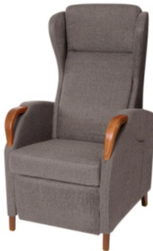
Model 584 Elevo