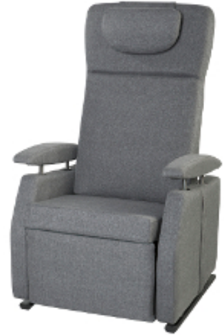
Model 574 Vario