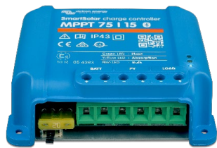
SmartSolar Laadcontroller MPPT 75/15