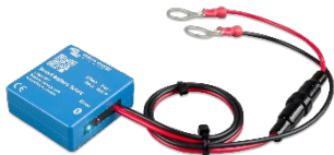
Bluetooth-detectie Smart Battery Sense