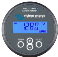
Bluetooth-detectie BMV-712 Smart Battery Monitor