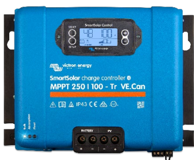
SmartSolar Laadcontroller MPPT 250/100-Tr VE.Can met optioneel insteekbaar beeldscherm