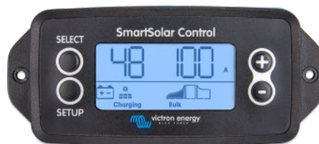
SmartSolar inplugbaar beeldscherm