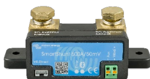
Bluetooth sensing: SmartShunt