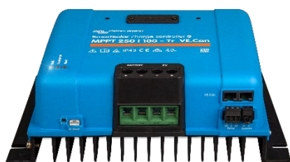
SmartSolar Laadcontroller MPPT 250/100-Tr VE.Can zonder beeldscherm