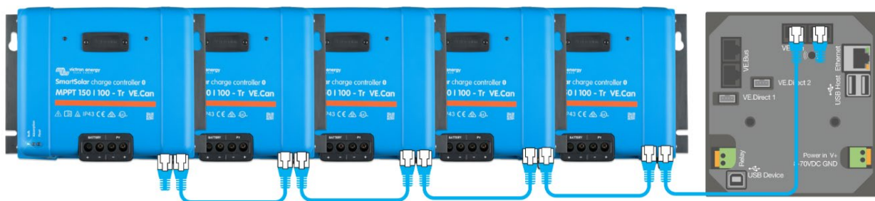
Met VE.Can kunnen tot 25 Laadcontrollers in een serie gezet worden en verbonden worden met een Color Control GX of ander GX-toestel Elke Controller kan individueel beheerd worden, bijvoorbeeld op een Color Control GX en op de VRM-website