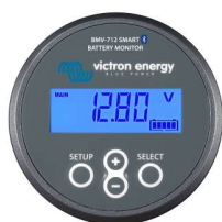
Bluetooth-waarneming: BMV-712 Smart Battery Monitor