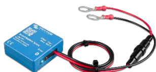
Bluetooth-waarneming: Smart Battery Sense