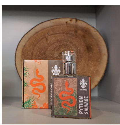
Fleur de Point