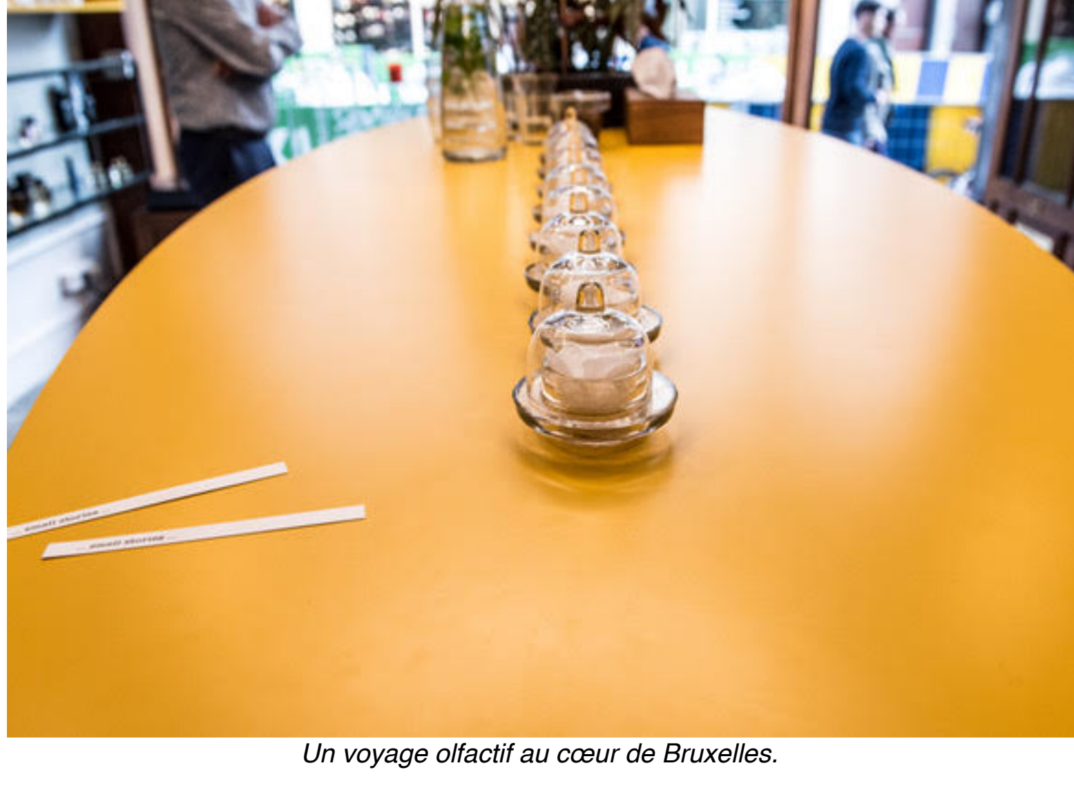
Un voyage olfactif au cœur de Bruxelles.