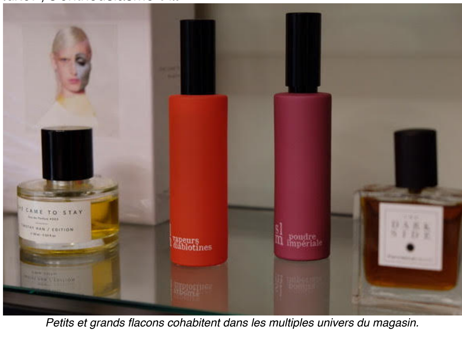
Petits et grands flacons cohabitent dans les multiples univers du magasin.