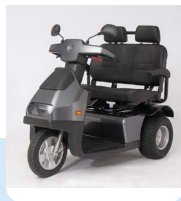
Opties en accessoires

Voorzien van rubberen (PU) schokabsorberende voorbumper voor maximale bescherming van de bestuurder. Nieuw ergonomisch stuur met een helder makkelijk af te lezen LCD display. Een luxe orthopedische draaibare zitting met hoge rugleuning. Extreem ruim! Verkrijgbaar in de kleuren donker grijs en rood.