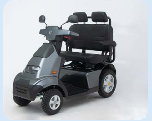
Dubbele zitting voor 2 personen