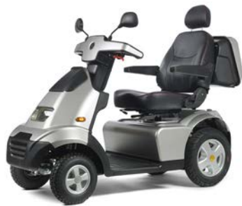
AfiScooter S4 Heavy duty uitvoering

De AfiScooter Breeze S4 Heavy Duty, de ultieme outdoor scootmobiel! Maximaal draaggewicht 250 kg!