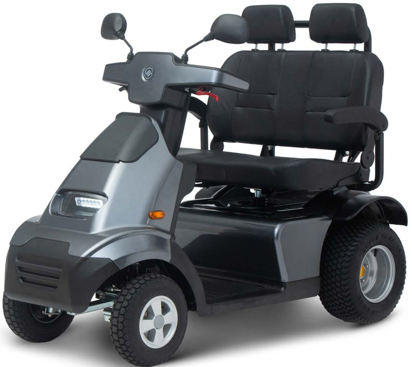
Breeze S4 model PLUS kleur donker grijs voorzien van GT pakket en een dubbele zitting.