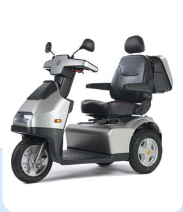
Breeze S3 HD Heavy duty uitvoering

De Breeze S3 Heavy Duty, de ultieme outdoor scootmobiel!