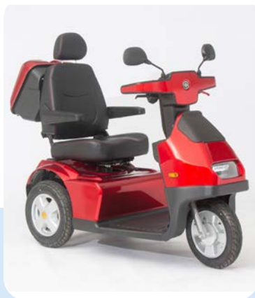
Breeze S3 PLUS

Voorzien van rubberen (PU) schokabsorberende voorbumper voor maximale bescherming van de bestuurder. Nieuw ergonomisch stuur met een helder makkelijk af te lezen LCD display. Een luxe orthopedische draaibare zitting met hoge rugleuning. Extreem ruim! Verkrijgbaar in de kleur zilver.