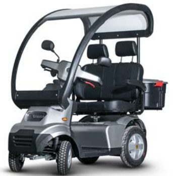
Opties en accessoires

Voorzien van nieuwe rubberen (PU) schokabsorberende voorbumper voor maximale bescherming van de bestuurder. Nieuw ergonomisch stuur met een helder makkelijk af te lezen LCD display. Een luxe orthopedische draaibare zitting met hoge rugleuning. Extreem ruim! Verkrijgbaar in de kleuren donker grijs, blauw en rood.