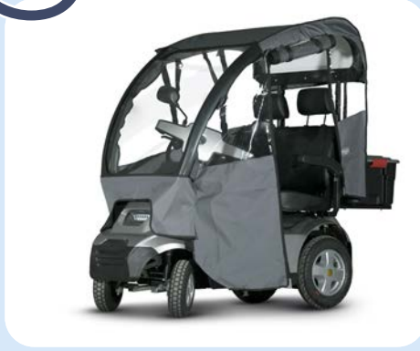
Regenscherm (alleen i.c.m. overkapping)