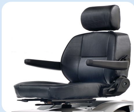
Bredere zitting (56 cm of 61 cm)