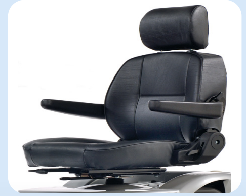
Bredere zitting 56cm of 61cm