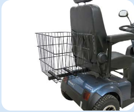
Mand, bevestiging achterop