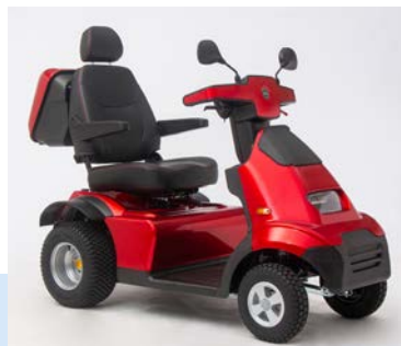
AfiScooter S4 Nieuw

Voorzien van nieuwe rubberen (PU) schokabsorberende voorbumper voor maximale bescherming van de bestuurder. Nieuw ergonomisch stuur met een helder makkelijk af te lezen LCD display. Een luxe orthopedische draaibare zitting met hoge rugleuning. Extreem ruim! Verkrijgbaar in de kleur zilver.