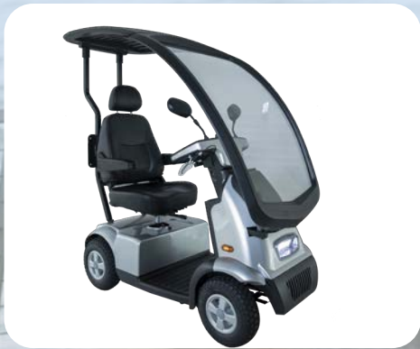
Overkapping, alleen geschikt voor 4-wiel