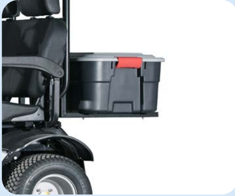
Gesloten box Alleen voor dubbele zitting / overkapping