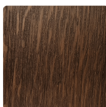
EIKENHOUT GELAKT LEEM