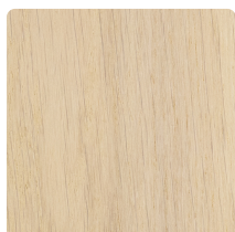
EIKENHOUT GELAKT WHITE WASH