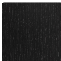
EIKENHOUT GELAKT ANTRACIET