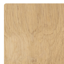
EIKENHOUT GELAKT GROOVE