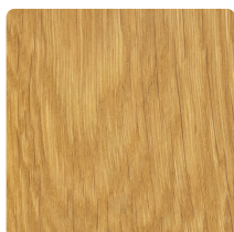
EIKENHOUT GEOLIED BLANKE OLIE