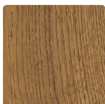
EIKENHOUT GELAKT TABACCO LIGHT