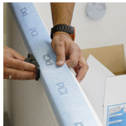
PCI Pecitape WDB met een roller stevig aandrukken, zodat geen vouwen ontstaan.