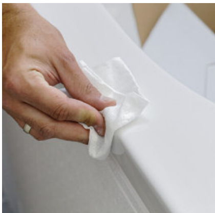
De rand van de bad/douchekuij goed reinigen en drogen.