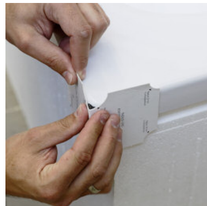
Met behulp van een met was voorzien sjabloon tot een rechte hoek modelleren.