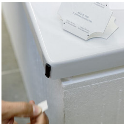
Na bepaling van de diameter van de kuit met een sjabloon, één of meer hoekvulstoffen aanbrengen.