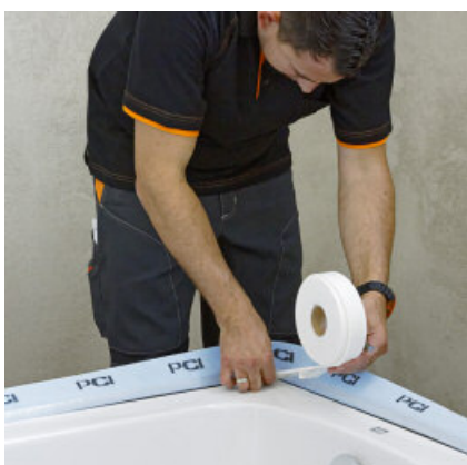
Afstandband tegen de badkuitprand aanbrengen.