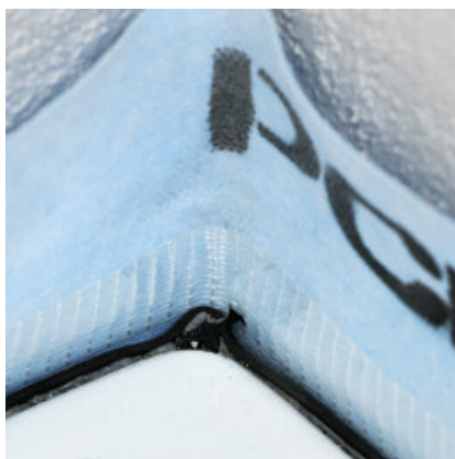
Het dichtband moet in de aansluitingshoeken wand/wand zonder spanning worden aangebracht.