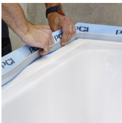
Eventueel PCI Pecitape Protect in de voorgevormde vouw van PCI Pecitape WDB aanbrengen.