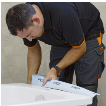
Beschermfolie verwijderen en PCI Pecitape WDB zonder spanning met de bovenkant van schuim tegen de badkuit aanbrengen.