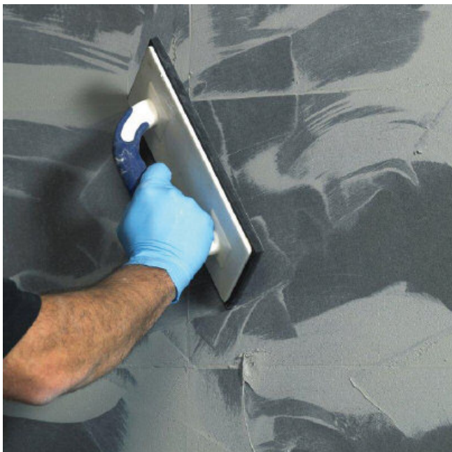
Smeuïge, gemakkelijke verwerking met een verwerkingstijd van ca. 40 minuten.