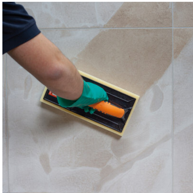
Eenvoudig nawassen, brandt niet aan de tegel.