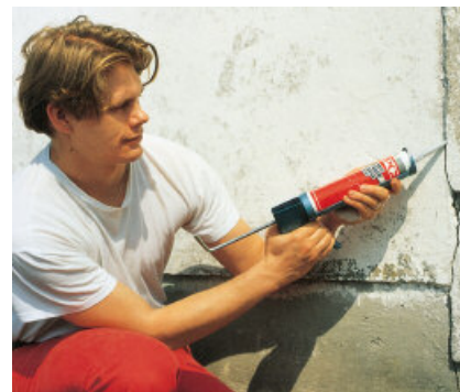
Scheuren in pleister kunnen met PCI Adaptol elastisch worden gevuld.