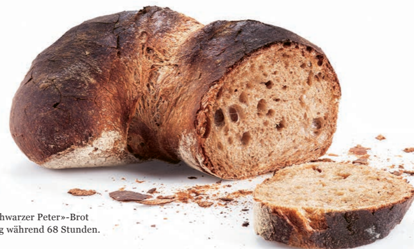
Beim «Schwarzer Peter»-Brot reift der Teig während 68 Stunden.