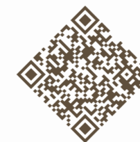
TREICHLER ZUGER KIRSCHTORTE ONLINE-SHOP